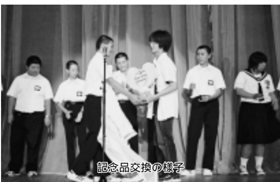
記念品交換の様子

技もけっこう上手でした。今回はあまり交流できなかったけど演劇を楽しく見れて良かったです。交流はもつとあつた方がいいと思います。同志社大学田辺キャンパス今出川キャンパスを見学して建物が見学するときのルールなどもすごく広くておどろきました。今回京都で学んだことは、団体行動の時のマナーを守るこの大切さや歴史ある建物を見学するときのルールなどです。今回の同志社交流で交流は少なかつたけど、京都で楽しく過ごせたので良かったです。今回京都に行っているいろいろな体験ができて本当に良かったです。ありがとうございました。