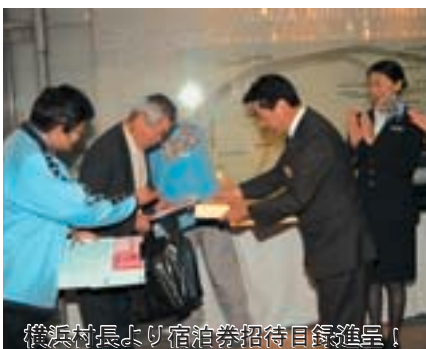
横浜村長より宿泊券招待目録進呈