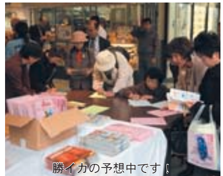
勝イカの予想中です