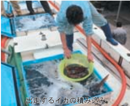
出走するイカの積み込み

11月11日、第15回風間浦村大規模観光キャンペーン「元祖烏賊様レース」が今年も、東京銀座の銀座ナイン2号館前で開催されました。 今年で15回目となったこの観光キャンペーンは、すっかり銀座の秋の風物詩として定着しており、烏賊様レース、風間浦村物産展共に大盛況でした。 特に烏賊様レースでは、参加料2千円を払ったオーナーには、参加料相当以上の特産品セットと泳いだイカがプレゼントされました。また各レース優勝者には、イカサマセット(活イカ、アワビ、タコの詰め合わせ)の目録が手渡されました。また3連単制でも、2人の方が見事的中させ、下風呂温泉ペア宿泊券の招待目録が進呈されるなど、大変な盛り上がりでした。