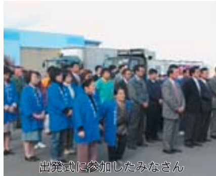
出発式に参加したみなさん