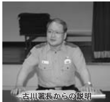
古川署長からの説明

なお、大間警察署では再編後の対応として、パトローラーの巡回活動を増やし、治安維持を一層強化する方針です。