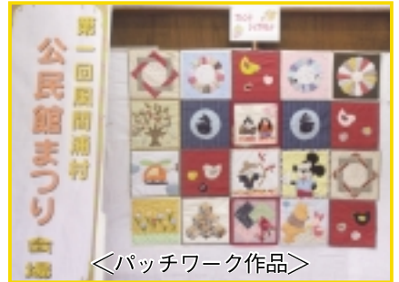
＜パッチワーク作品＞