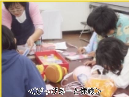
＜びっぴあーと体験＞