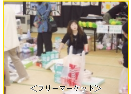
＜フリーマーケット＞