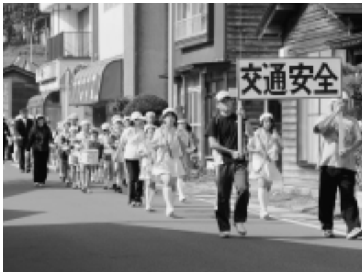
たくさんの方がパレードに参加しました

での間、秋の全国交通安全運動が展開され、関係する皆さんのご協力の下、街頭パレード、街頭指導、交通安全旗の設置、反射タスキの配布やカーブミラー清掃など様々な交通安全活動が行われました。