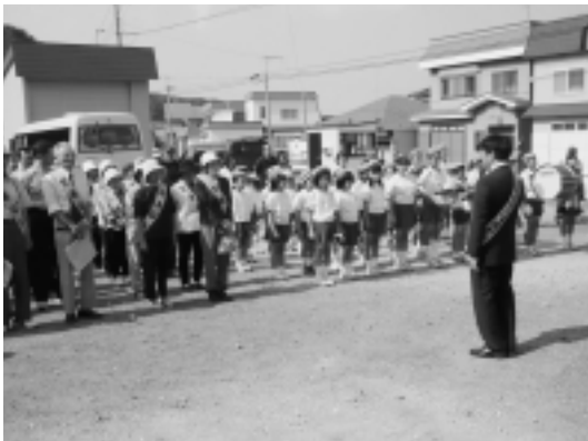
小学校鼓笛隊もパレードに参加