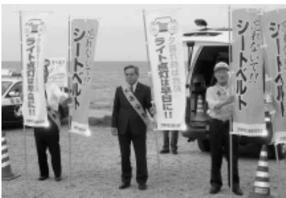
ふのり公園での啓発活動