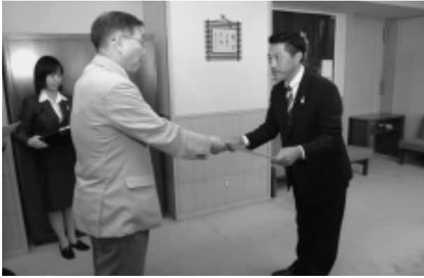
蝦名副知事より表彰状を授与されました

風間浦村は十五年の達成に向け、今年も春から関係団体をはじめ、村民皆様からのご協力をいただいて街頭指導、街頭パレード、マスコット配布等の様々な活動をしてきました。中でも、夜間の歩行者や自転車乗