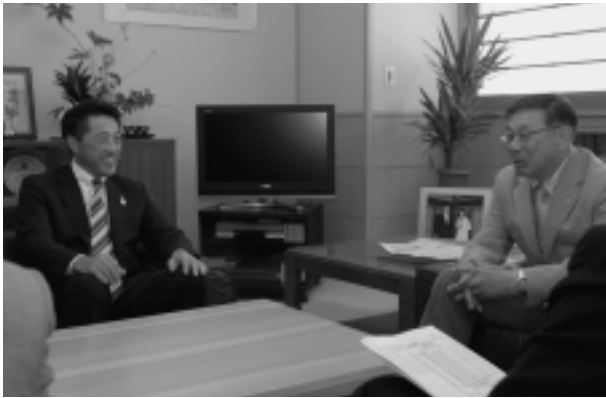
地域の交通事情を説明

これからも交通安全には十分注意し、村民生活の安全安心へのご協力をよろしく願います。