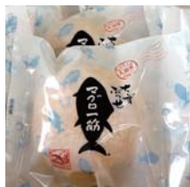
大間・まぐろフッセ ¥140