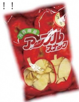
アップルスナック ¥400