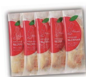
りんごスティックパイ 1個¥160/1箱¥780