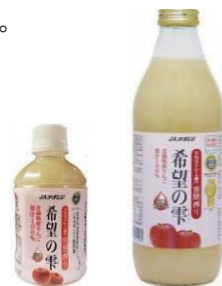
希望の雫 ペットボトル1本¥150 瓶1本¥370

このほかにも多数商品を揃えてお待ちしております! 数量限定販売となります。売り切れの際はご了承ください。※価格はいずれも税込