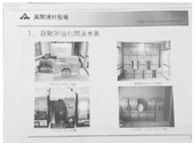
避難所強化関連事業として準備された備品