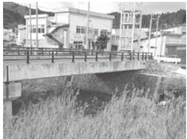
易国間川に注ぐ生活排水