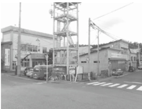
役場庁舎・消防分署

庁舎の安全な場所への移転についても、慎重な判断が求められており、住民の安全を支える防災拠点、心のこもった対応のできる行政拠点となる