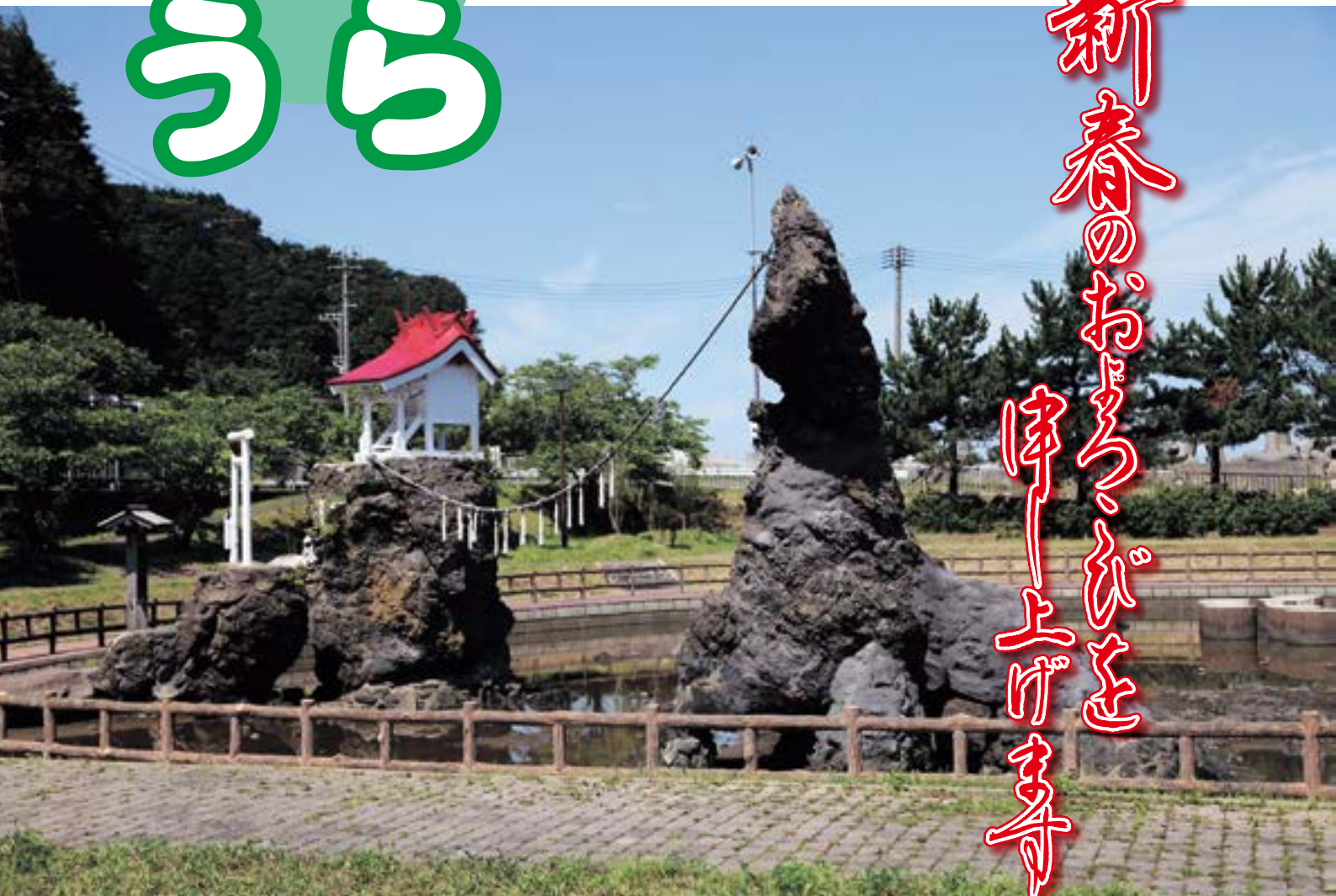
二見岩（海峽いさりび公園）