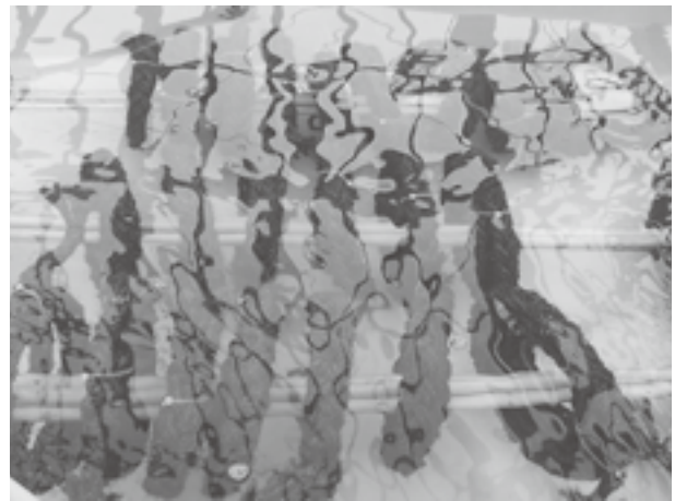
親コンブからの胞子の採取状況