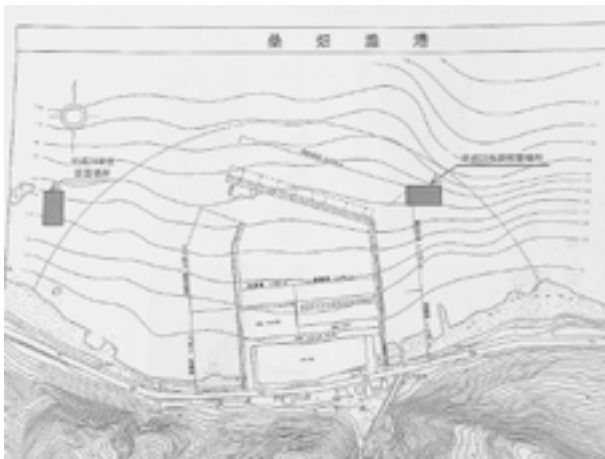
平成25年度藻場造成場所