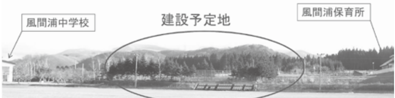
小学校建設予定地