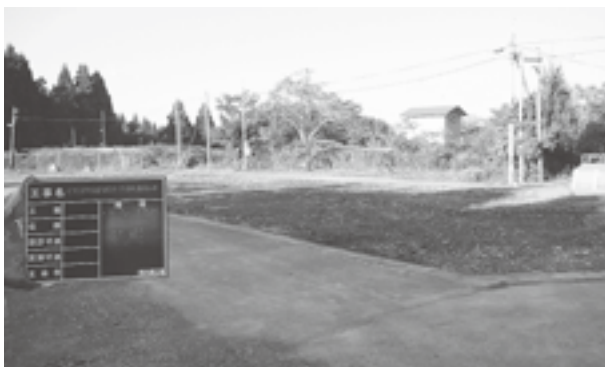
寺の上団地解体後