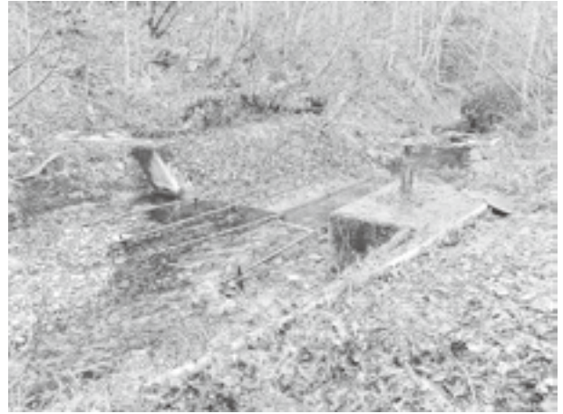
易国間地区取水口