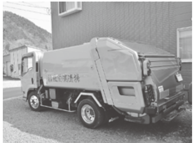
ごみ収集運搬事業