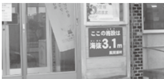
役場庁舎の海拔表示