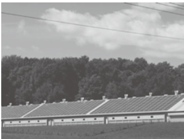
再生エネルギー事業の太陽光発電