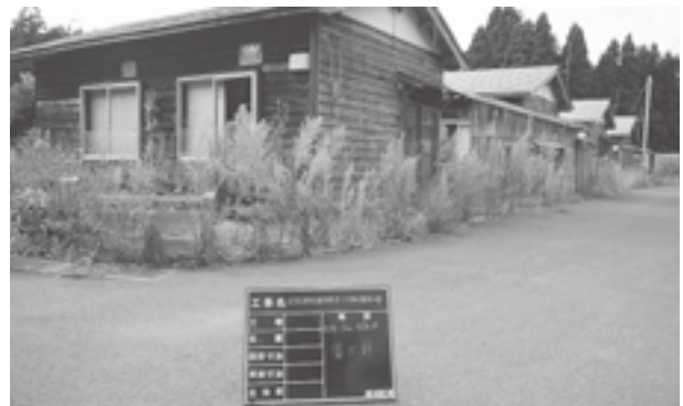
寺の上団地解体前