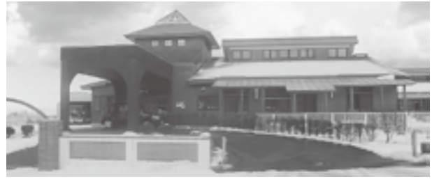
指定管理が予定される風間浦保育所