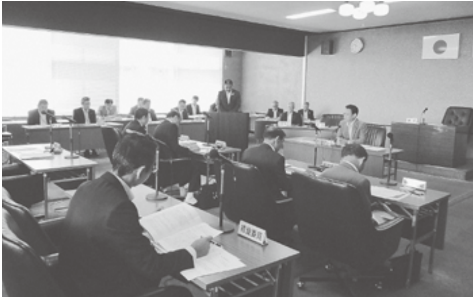
特別委員会の様子

6時間で浴槽に溜めることができ、温度については、保温用温水パイプを使用する予定で100mで1度も下がらない。