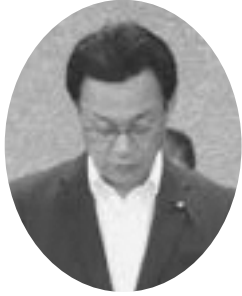
杉山 太 議員