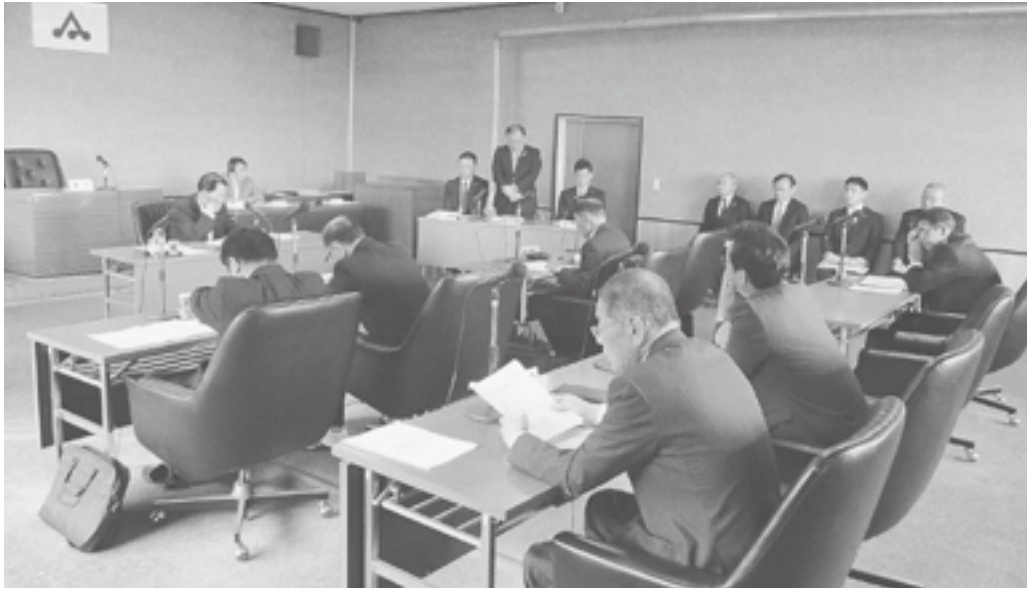
会社からの報告 (原特委)