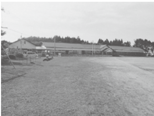
旧蛇浦小学校グラウンド