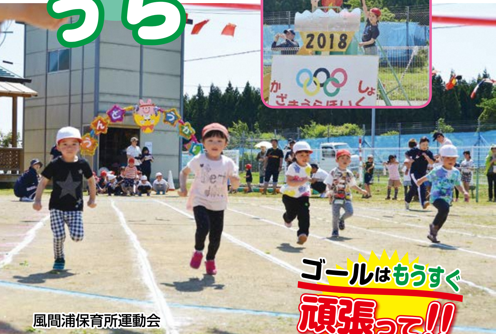
風間浦保育所運動会