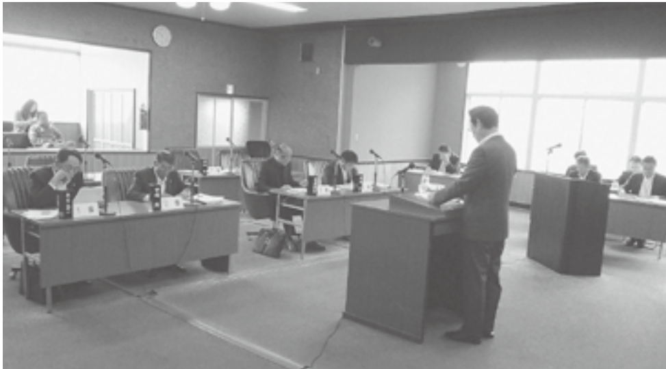
定例会における一般質問