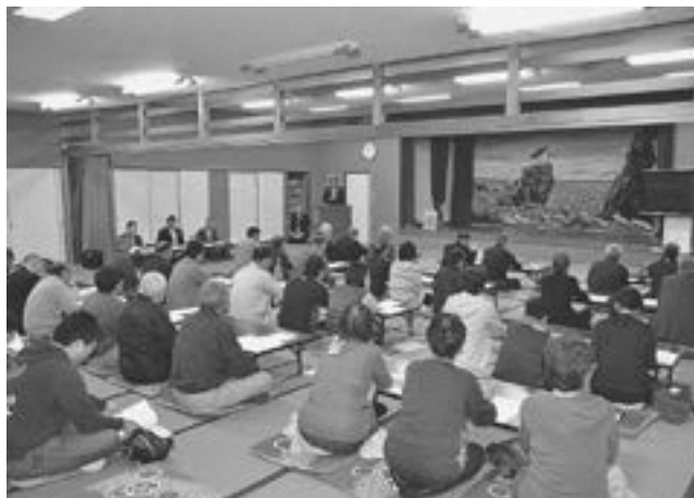
下風呂公民館で開催された住民説明会