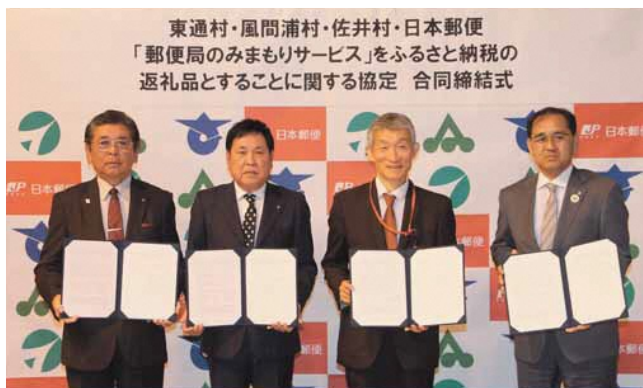
郵便局のみまもりサービス合同締結式