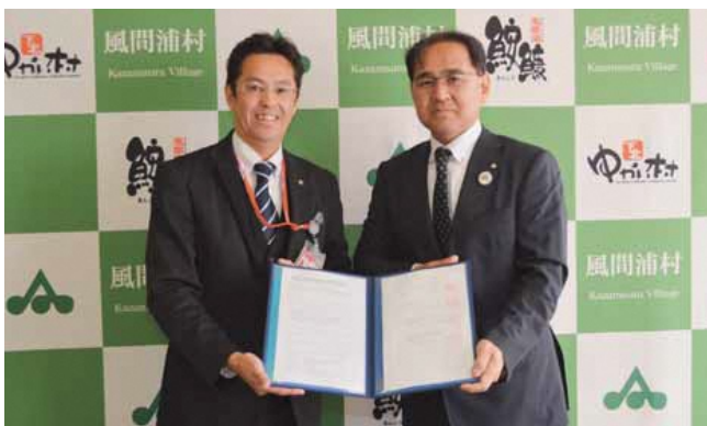
災害発生時の協定調印式

双方が相互に協力し、必要な対応を円滑に遂行するために更なる連携強化を図っていきます。