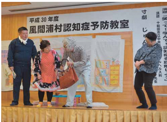
じゅんちゃん一座