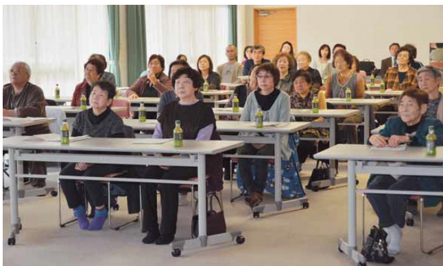
たくさんの方に参加していただきました

約50名の参加者の皆さんと一緒に、認知症について理解を深める良い機会となりました。