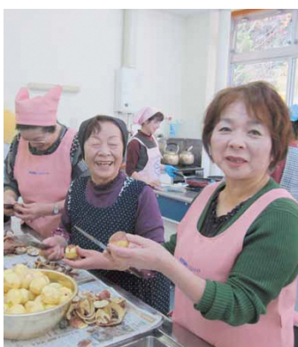
じゃがいもの皮むきタイム

シニアカフェでは、じゃがいもの皮むきなどの調理作業の後にラジオ体操、頭の体操などを行い、昼食にはみんなで調理したものを楽しみ、和気あいあいとした楽しい時間を過ごしました。いろいろな人と交流しながら調理や食事を楽しむことは、心の栄養補給にもなりました。また、ウォーキングポールについての説明を受けた参加者からは、実際にポールを使ってみると「歩きやすくなった」「姿勢がよくなる」などの声も聞かれました。自宅での運動やウォーキング時に活用でき、体力の保持・増進になるウォーキングポールは無料です。村民生活課（TEL3513111）にて貸し出しを行っていますので、お気軽にご連絡ください。