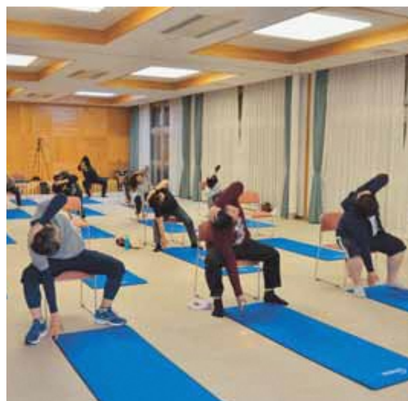
やっぱり体を動かすって気持ちいい～

まのご参加をお待ちしております。 今回のフィットネスクラブは、12月14日（金）に 開催します。今年度最後となりますので、みなさ