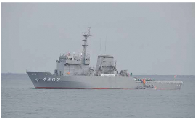
多用途支援艦「すおう」