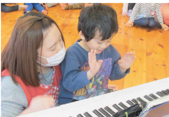
エレクトーン楽しい～♪

音楽は、言語能力や知能活性化などに良いと言われています。ぜひご家庭でも、家族みんなで音楽に親しむ時間を持つてみてはいかがでしょうか。