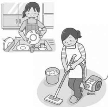
簡単な家事 屋内外掃除・窓ふき等