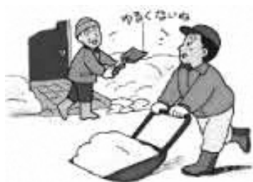
雪かき (屋根雪を除く)