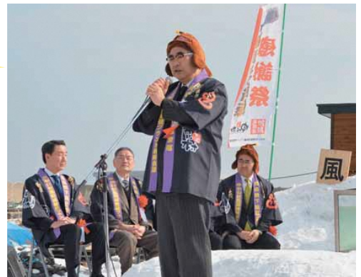
駒嶺会長のあいさつ