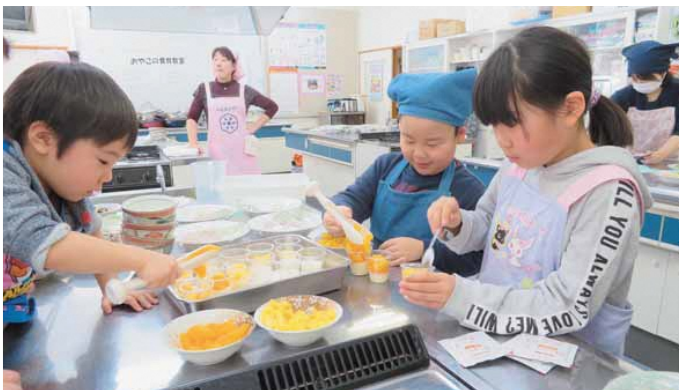
フルーツたっぷり入ったババロア作るぞ～!