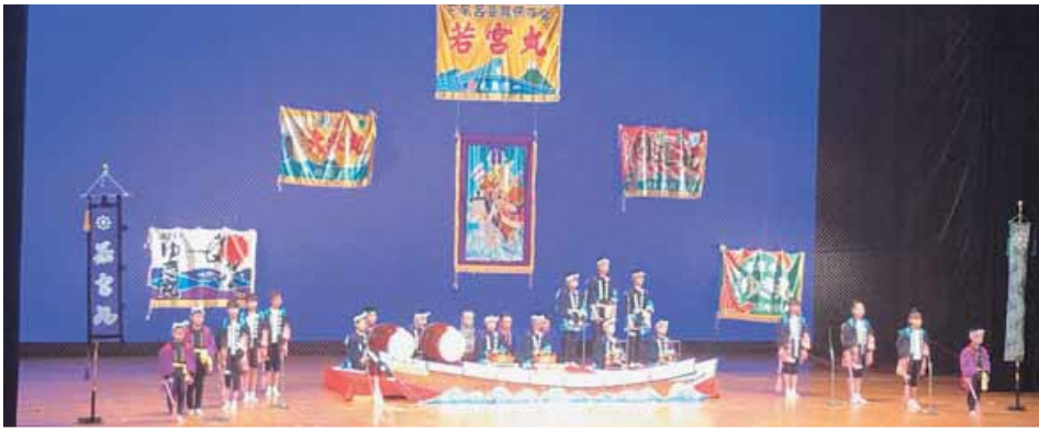
下風呂若宮稲荷神社祭り囃子

第34回下北地区子ども会郷土芸能発表会が、2月3日(日)下北文化会館において、下北地区の子どもの交流と健全育成及び郷土芸能の伝承を目的として開催されました。