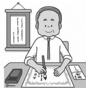
宛名・賞状書き 簡単な事務・整理 等