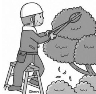
植栽の剪定 (高所を除く)