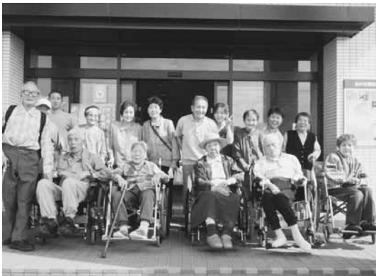
アルサスにて (佐井村へバス遠足)