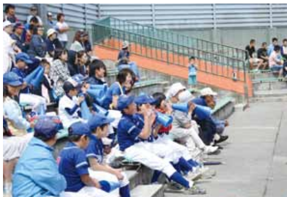
熱烈に声援をおくる風間浦フェニックス応援団