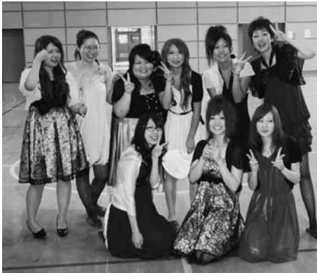
久しぶりの再会の記念に