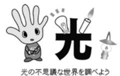
光の不思議な世界を調べよう

エジソン電球の実験や、光のスペクトル観察、レーザー光線による光通信の実験を通して、光の不思議な現象を見ることができます。