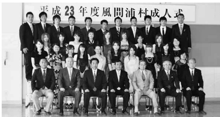
中学校時代に過ごした学び舎での成人式に参加し記念写真に納まる新成人