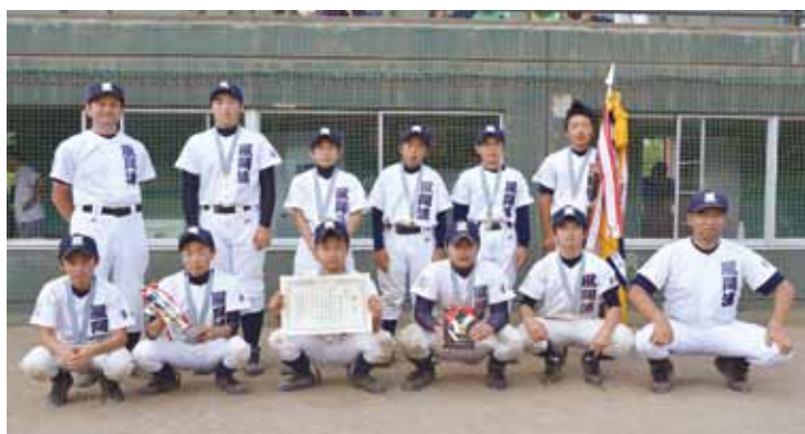
中学校の部で優勝した風間浦中学校チーム