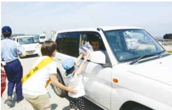
“交通安全お願いします”と一声かけながら手作りの交通安全啓発グッズを手渡す子どもたち