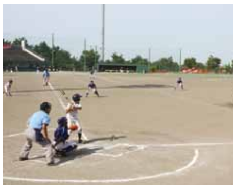
力投する投手を盛り上げる 風間浦フェニックス守備陣（県大会）

むつ支部予選で見事優勝した風間浦フェニックスは、地域の皆さんへ優勝の報告と県大会での活躍を誓い、村内のパレードを実施しました。その際には温かい声援とたくさんの方の寄附を頂きました。集まった寄付金60万円あまりは、県大会出場に伴う選手のためと、今後のスポーツ少年団の活動に役立てさせていただきます。ありがとうございます。