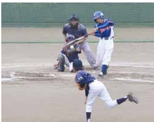
熱戦を繰り広げた試合の様相（小学校の部）