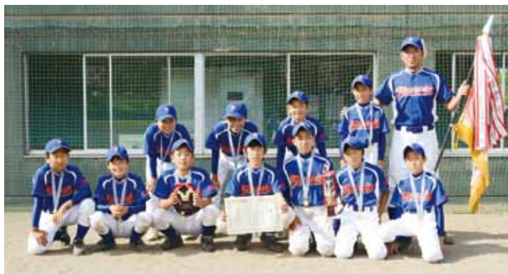
小学校の部で優勝した風間浦フェニックスチーム