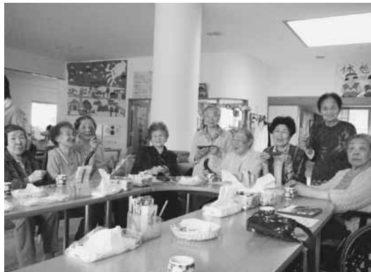
笑顔♪ (収穫したキュウリを手に)