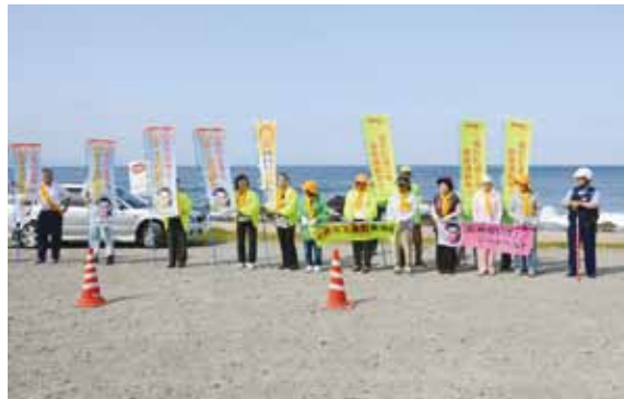
蛇浦地区国道279号で交通安全街頭指導を行う関係者