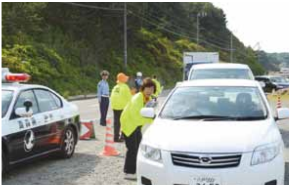
道行く車にパンフレットを手渡し交通安全を呼び掛ける関係者