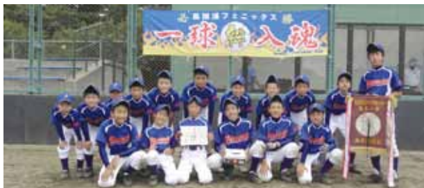
むつ支部予選で優勝を果たし喜ぶ風間浦フェニックスの選手