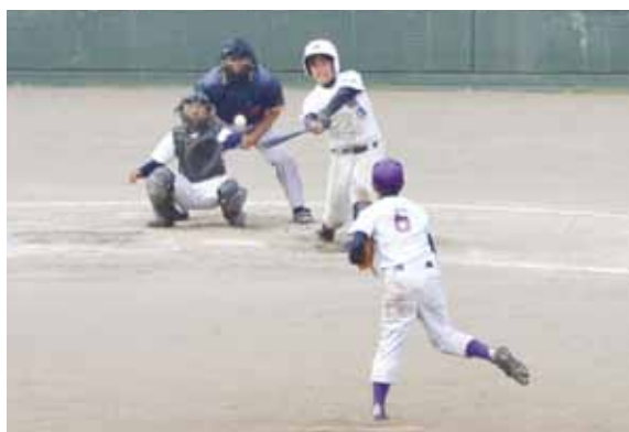
延長戦までもつれ込んだ中学校の部決勝戦の様子