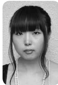
い せ ち づ る 越膳 ちづる