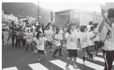
函館港まつりでのイカ踊り

フェリー港でのお別れの際は、来年、風間浦村で行われる交流会での再会を約束し合いました。