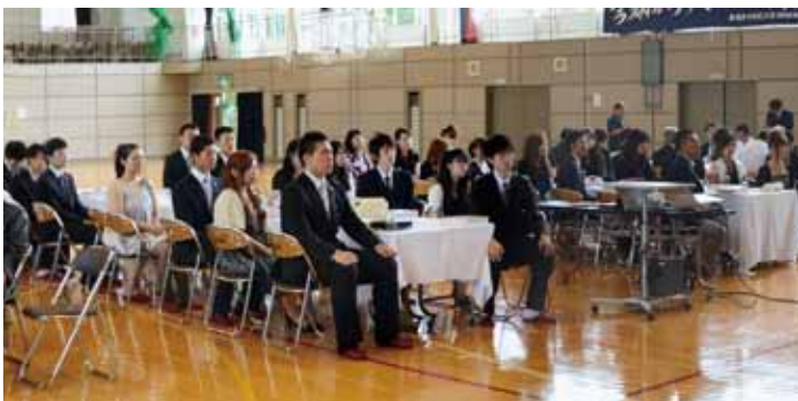
緊張した面持ちで式典に臨む新成人（中央）