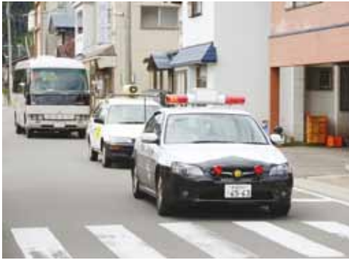
易国間本通りを車両にて交通安全を呼び掛ける関係者