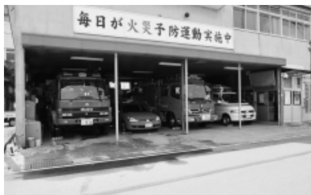
(風間浦消防分署運営事業)