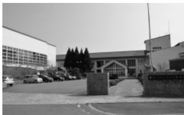
(風間浦中学校維持運営事業)