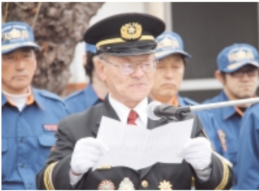
五十洲消防団長による現況報告

会場を易国間漁港に移し表彰式、一斉放水、纏振り演技、ポンプ操法が行われ、五十洲団長の答辞が述べられたあと、参加者全員による万歳三唱で閉会となりました。