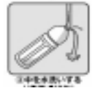
②中をすすいでいる