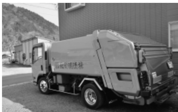
(ごみ収集運搬事業)

また、その一部を将来的な村財政の安定化を図るため、基金（貯金）として積み立てを行っています。