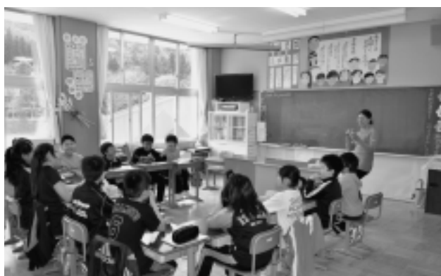
(風間浦村英語教育推進事業)