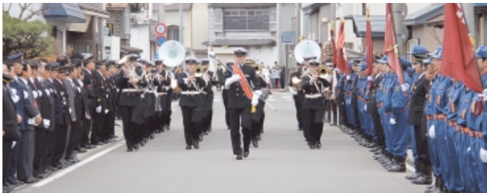
海上自衛隊大湊音楽隊による演奏行進