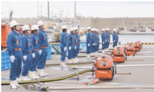
小型動力ポンプ操法