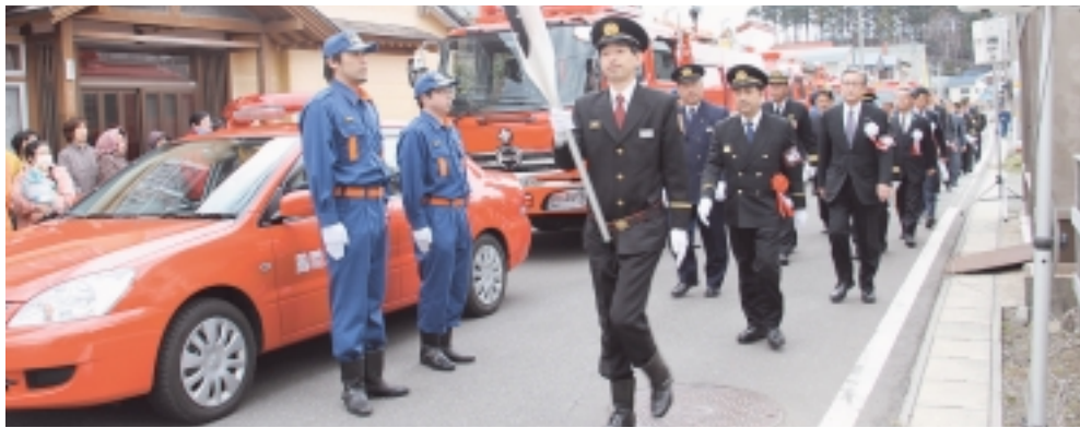
人員服装及び機械器具点検