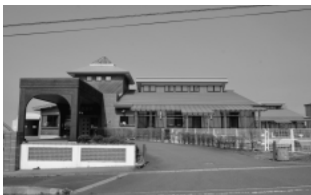
(風間浦村保育所サービス提供事業)