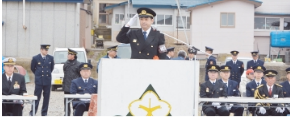
観閲者 飯田村長訓示