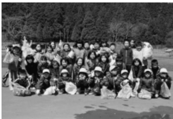
たくさんのゴミを拾い集めた子ども達

4月22日、易国間小学校33名の全校生徒、教職員及び保護者による学区内清掃が行われました。 易国間小学校では、子ども達が、自分で過ごしている地域を大切に、郷土に対する愛着心を、これまでに以上を持ってほしいと考え、学区内の清掃活動を実施しました。 子ども達は、3班に分かれ、学校の周りの国道及び村道を歩きながら道の脇に落ちているゴミを拾い集めました。 たくさんのごみを集めた子供たちは、自分たちは、絶対にごみは道路などには捨てないと感想を話していました。