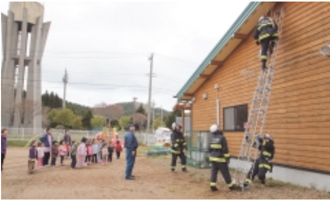
消防署員によるロープ取付け作業