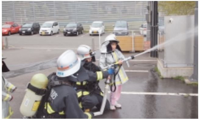
児童による放水活動