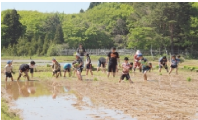
みんなで上手に植えました