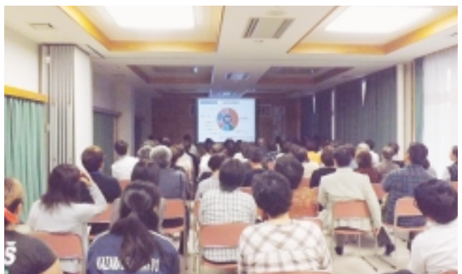
軽妙な講演に聞き入る受講者の皆さん