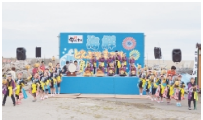
下風呂郷土芸能保存会による発表