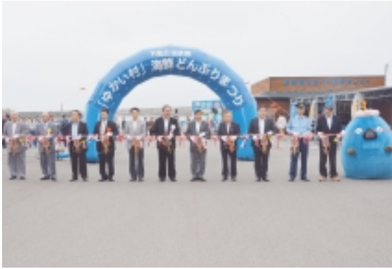
関係者によるスルメカット