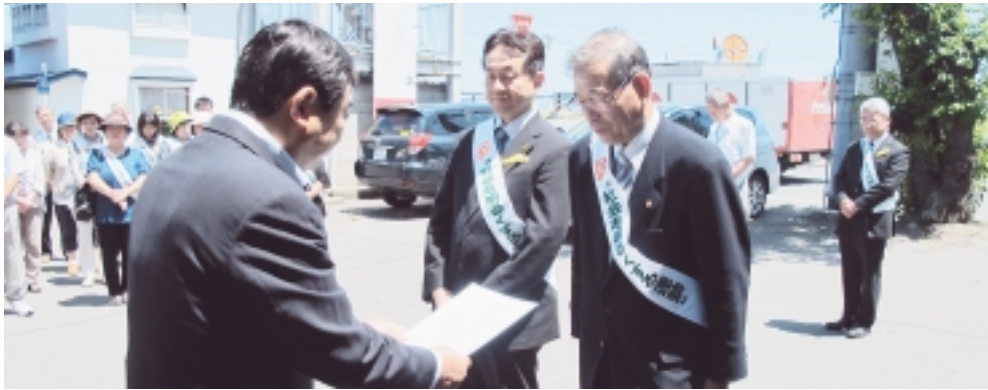
県知事からのメッセージ伝達

「立ち直りを支える取組についての協力の拡大」 「就労・住居等の生活づくりにつながる取組の推進」