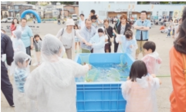
活イカすくい大会