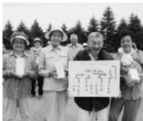
優勝おめでとうございます!!