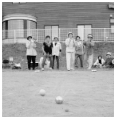
ナイスショットに拍手です