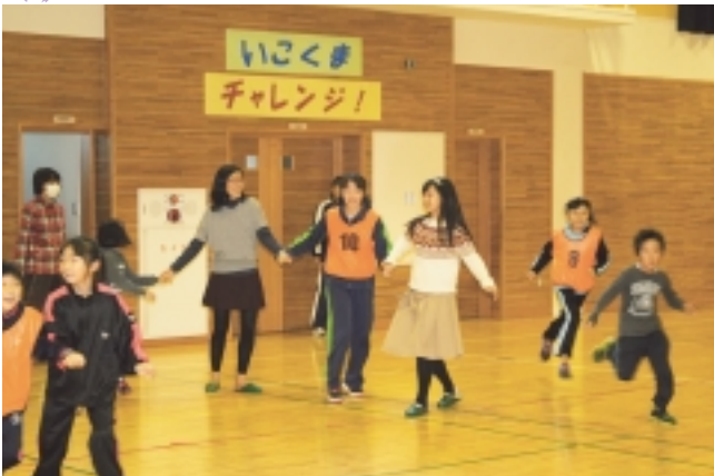
子どもたちとスポーツ交流