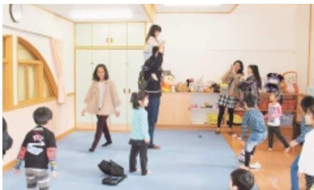
風間浦保育所の子どもたちとのふれあい