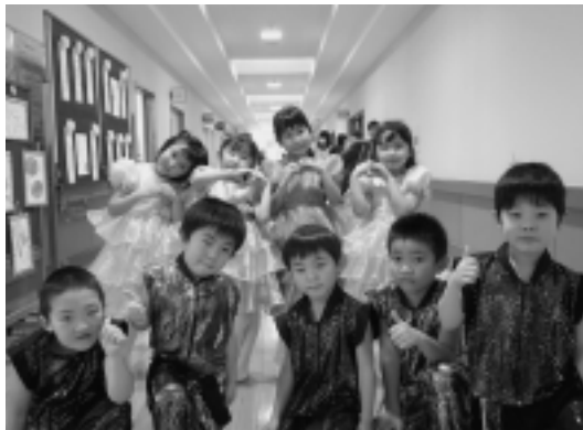
かわいい踊りでしたよ♪

また、駒嶺石油様より灯油400ℓを寄贈していただき、20枚の灯油券に分けて抽選でお配りしました。