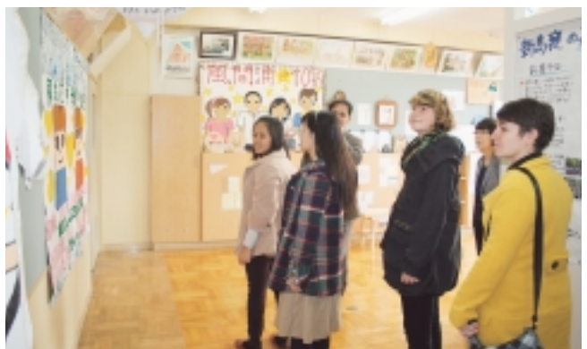
風間浦中学校同志社コーナーを見学