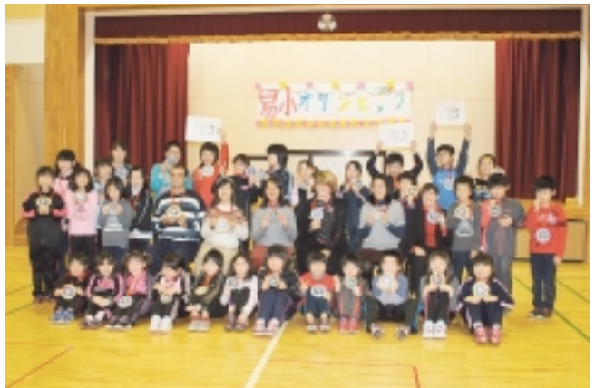
易国間小全校児童と記念撮影