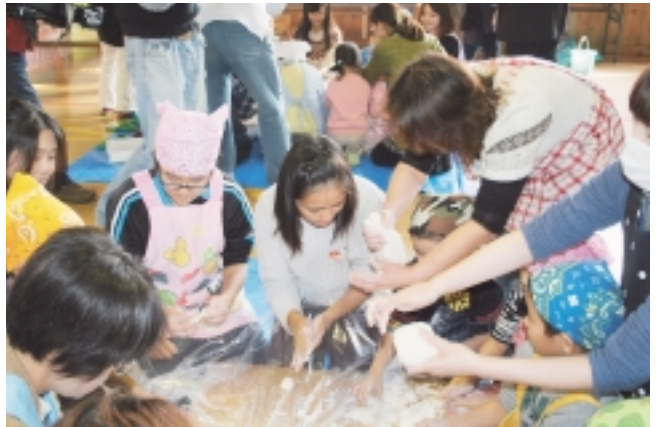
みんなでもちづくり