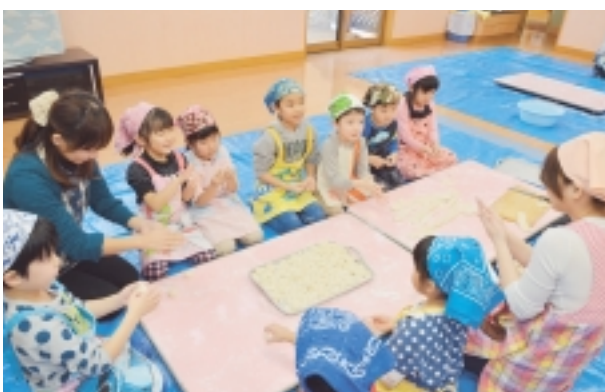
まるくなったかな?