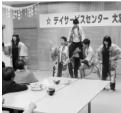
よさこいに会場興奮!!