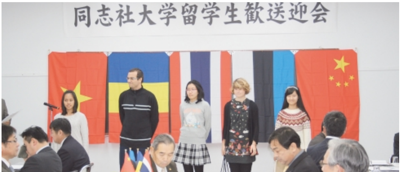
歓送迎会に参加する留学生