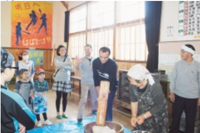
初めてのもちつき