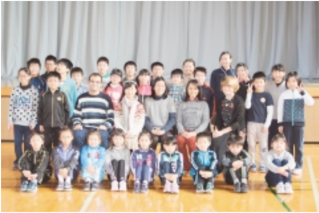
下風呂小全校児童と記念撮影