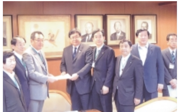
衆議院自民党筆頭副幹事長への道路要望活動