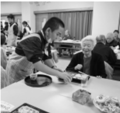
風中ボランティア頑張ってます!