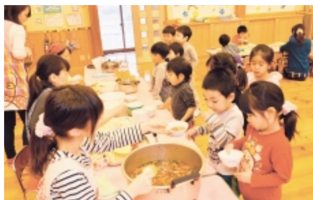
おかわりくださいーい!