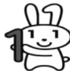
マイナンバー広報キャラクター 「マイナちゃん」