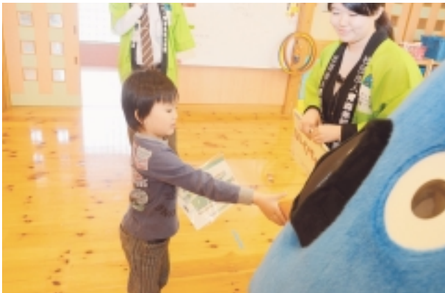
「いくべえ」プレゼントをありがとう