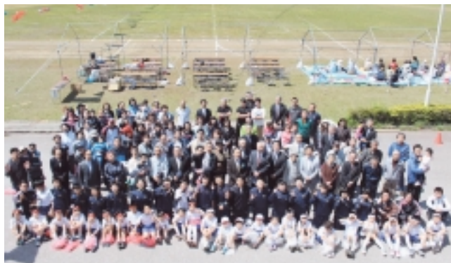
参加者皆さんと記念写真