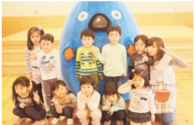
「いくべえ」と一緒に