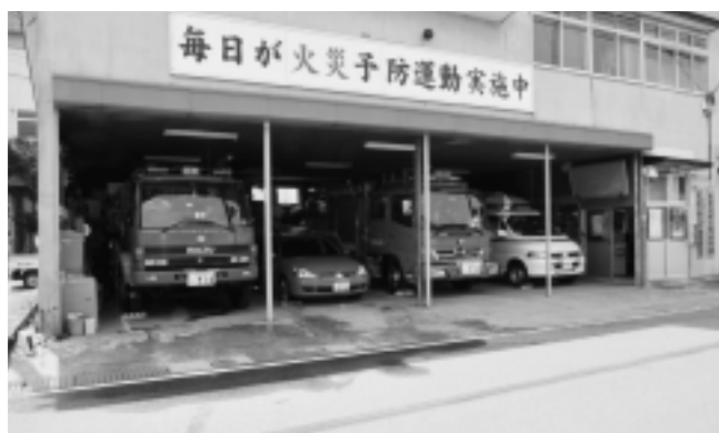
風間浦消防分署運営事業