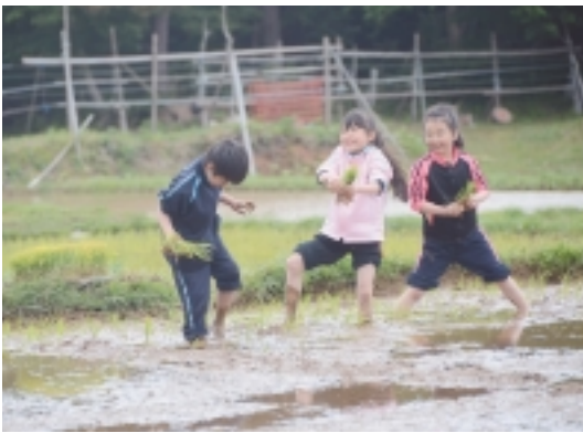
寒くても裸足で田んぼへ