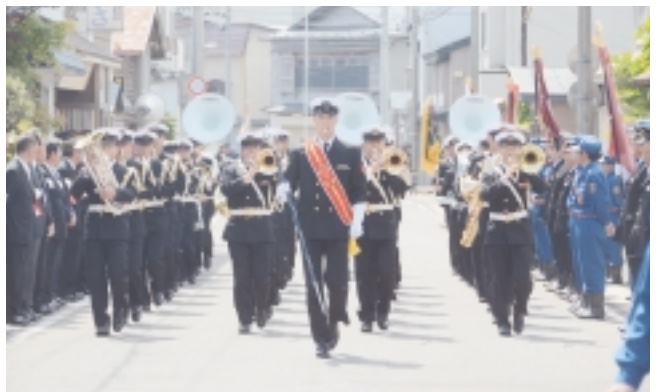
海上自衛隊大湊音楽隊演奏行進