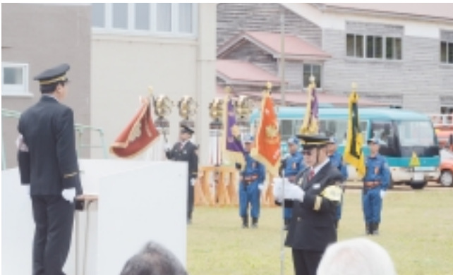
駒嶺団長による答辞