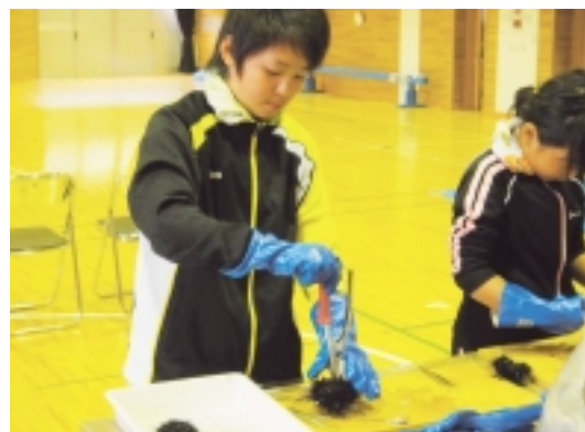
うにの解剖のようす