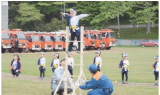
風間浦保育所幼年消防クラブによる演技