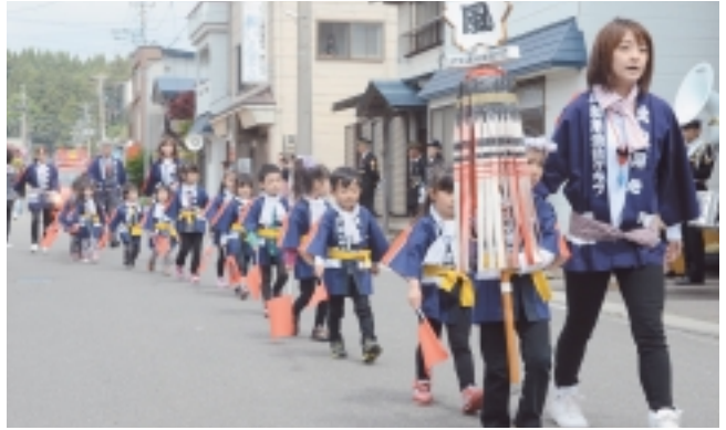
幼年消防クラブ分列行進