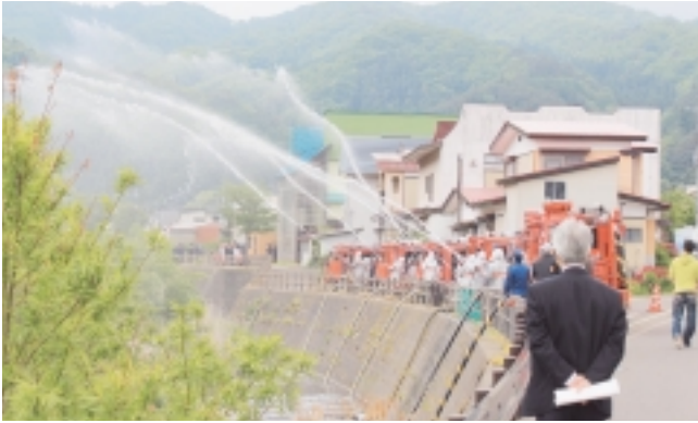
易国間川で行われた一斉放水