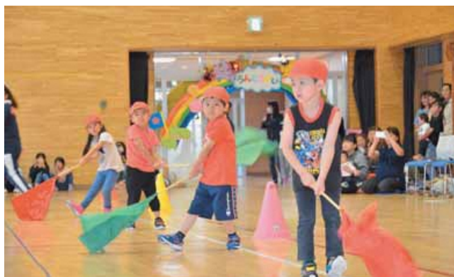
おゆうぎ (ぱんだ組)