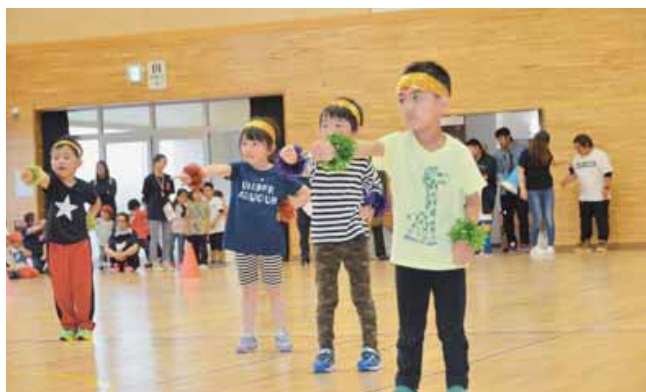
おゆうぎ (こあら組)