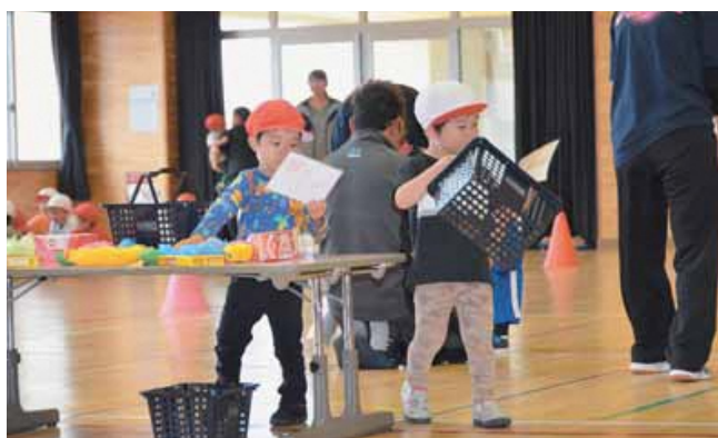
はじめてのおつかい

6月22日(土)、風間浦保育所運動会が開催されました。当日は、雨天のため風間浦小学校体育館で行われました。その姿を見た保護者や家族の方は、かけっこ・おゆうぎ・リレーなど一人ひとりが大活躍。また、親子競技や応援に駆け付けた地域の方が参加できる子どもたちの頑張りをたくさん紹介します。