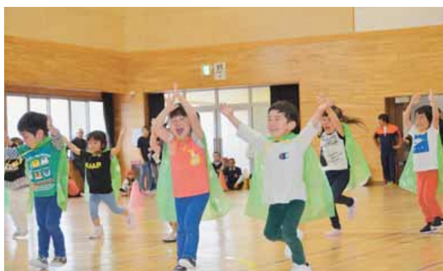
おゆうぎ (うさぎ組)