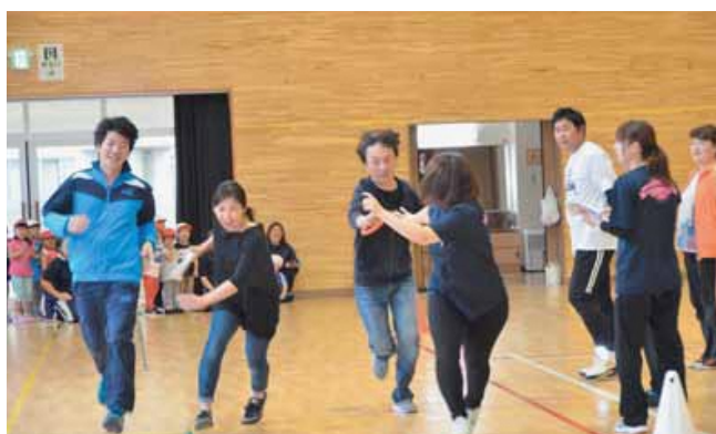
保護者対抗リレー