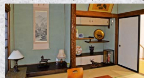
井上靖ゆかりの客室「展示室内部」