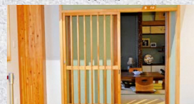
井上靖ゆかりの客室「展示室入口」