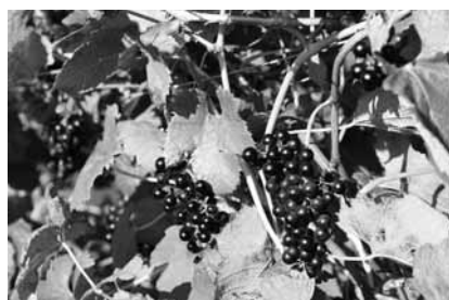
オリジナル品種 「北の夢」