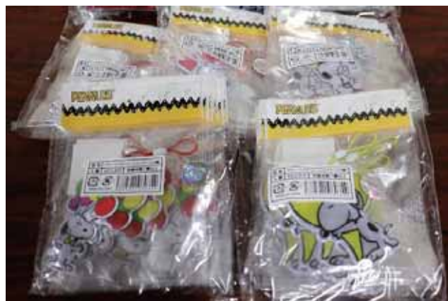
かわいい反射材が寄贈されました