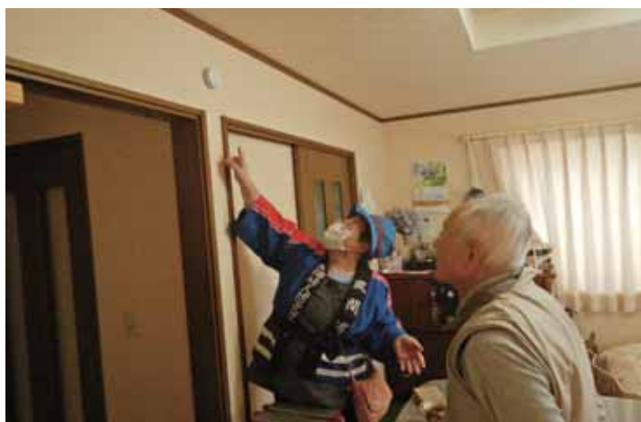
住宅用火災警報器配布事業（蛇浦地区）