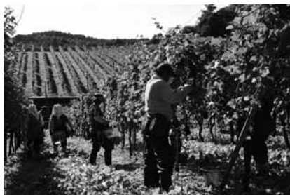
ピノ・ノワールを 収穫する皆さん

年末に向け、お酒を飲む機会が増える人も多いかと思います。下北ワインには多くの銘柄がありますが、水産業や畜産業が盛んな下北では、それに合う食材も揃います。下北の特権を活かして、旬の“地物”を味わいながらグラスを傾けてみてはいかがでしょうか。