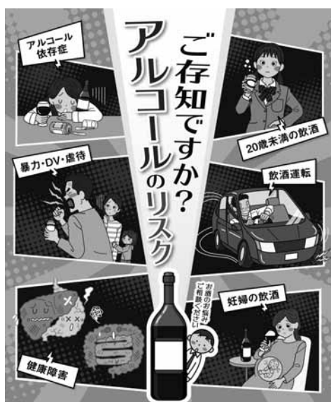
令和5年度アルコール関連問題啓発ポスター