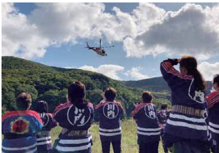
青森県防災ヘリ訓練視察（青森市）