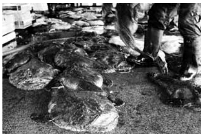
風間浦産のキアンコウ

このリレーがどこかで止まったり、対応が遅れたりすると、この貴重な研究成果は得られなかったことでしょう。実はむつ市奥内でも網で化石が引き上げられたことがあります。貴重な資料に気づき、捨てずに届けてくれた漁師さんに感謝せずにはられません。