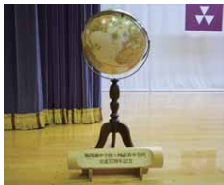
同中からの記念品