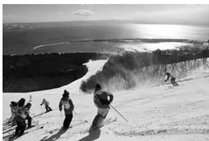
眼下に見える芦崎

2月11日のスノーフェスの釜臥山スキー場 (お出かけの際はリフトの運行状況をご確認下さい)