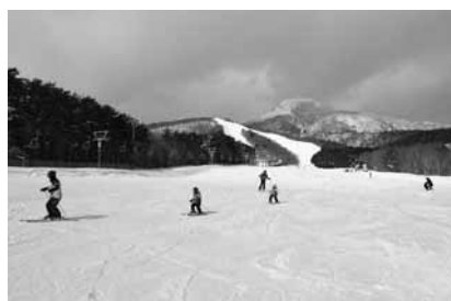
火山麓扇状地から 見上げる山頂