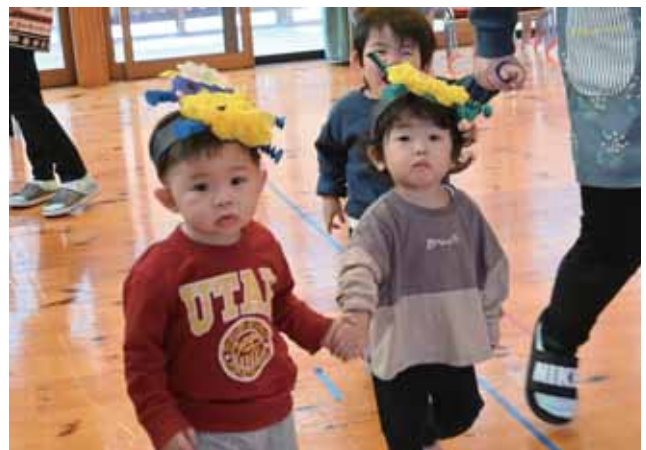
自分たちで作った個性豊かなお面