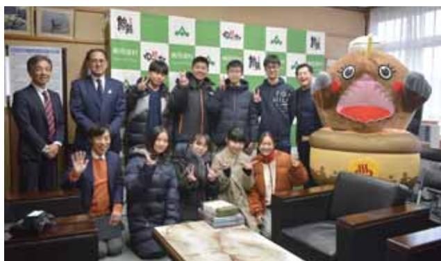
富岡村長と記念写真

同中生たちは風間浦村と同志社の縁の深さや歴史を学び、下風呂温泉と郷土料理を堪能し、風間浦村を後にしました。