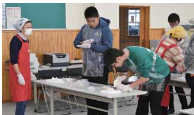
べこもち作り体験