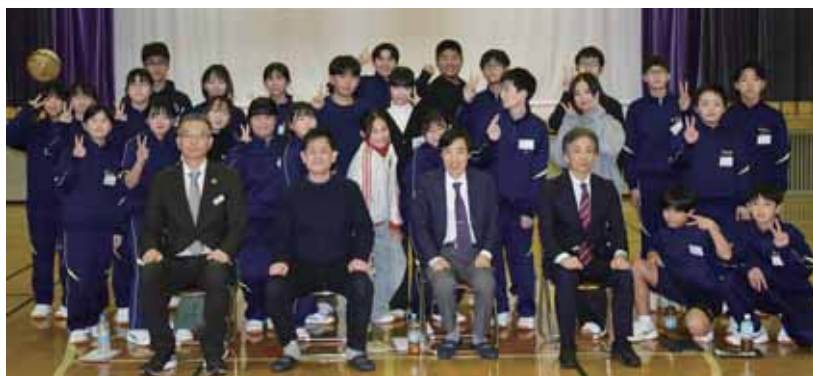
交流会後の記念撮影