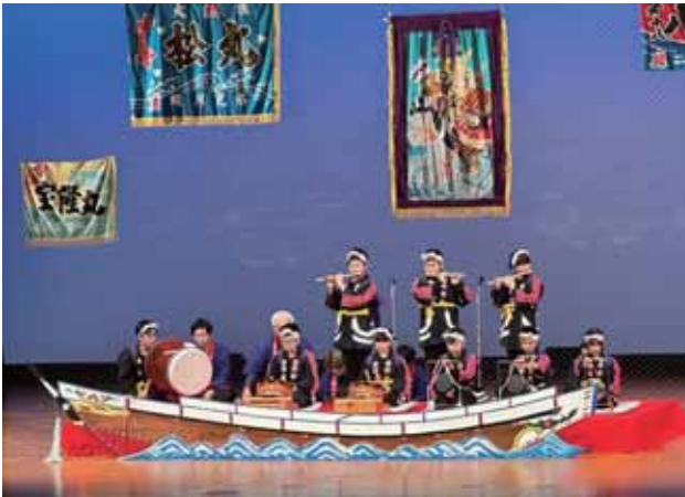
下風呂若宮稲荷神社祭り囃子 披露

2月11日（日）下北文化会館において、第39回下北地区子ども会郷土芸能発表会が開催されました。発表会は、下北地区の子どもの交流と健全育成及び郷土芸能の伝承を目的として始められましたが、コロナ禍を経て、4年ぶりの開催となりました。