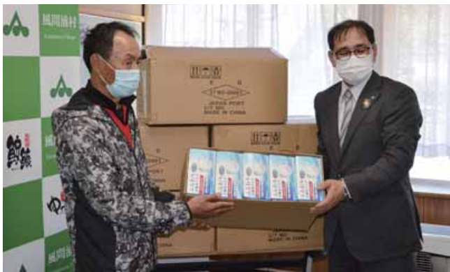
大間町・佐井村・当村に合計約4.7万枚の寄付

村では、小中学校の児童生徒に2箱ずつ（60枚）配付したほか、村内医療・福祉施設へも配付しました。