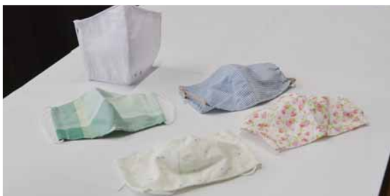
色とりどりのマスクです

手作りマスクは、花柄やチェック模様など約15種類で、寄贈されたマスクは村内の福祉関係で活用いたします。