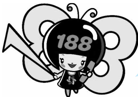
消費者庁 消費者ホットライン188 イメージキャラクター 「イヤヤン」

そんなときは一人で悩まずに、全国どこからでも3桁の電話番号でつながる消費者ホットライン「188（いやや!）」にご相談ください。専門の相談員がトラブル解決を支援します。