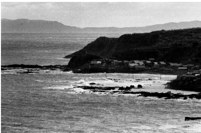
下風呂と大間との間の漁村