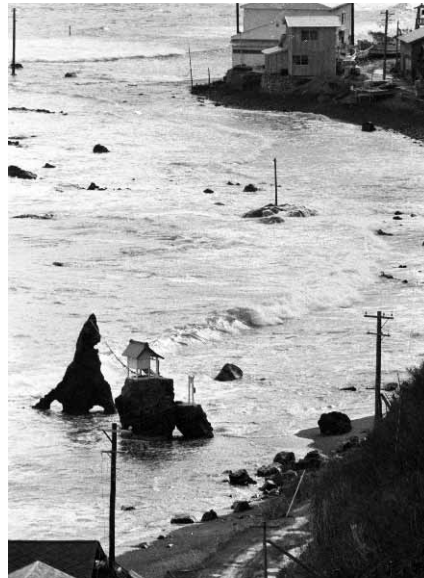
夫婦岩の見える高台から