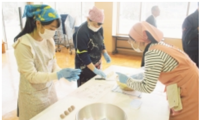
ベコもち作りの様子