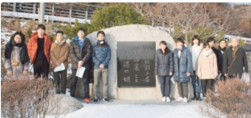
新島襄寄港の地碑前にて記念撮影