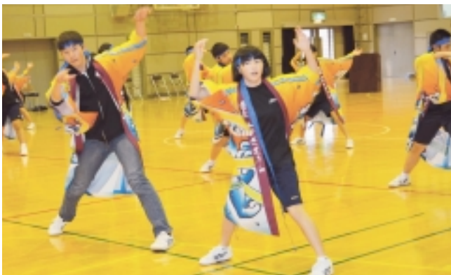
風中ソーランの様子