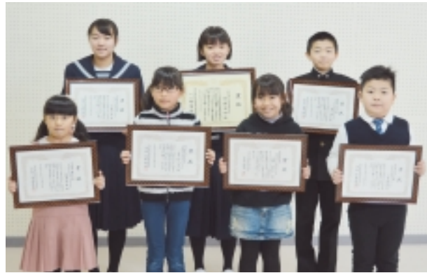
受賞者のみなさん、おめでとうございます!!