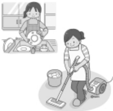
簡単な家事 屋内外掃除・窓ふき等