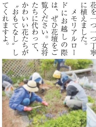
みんなで手分けして草むしり