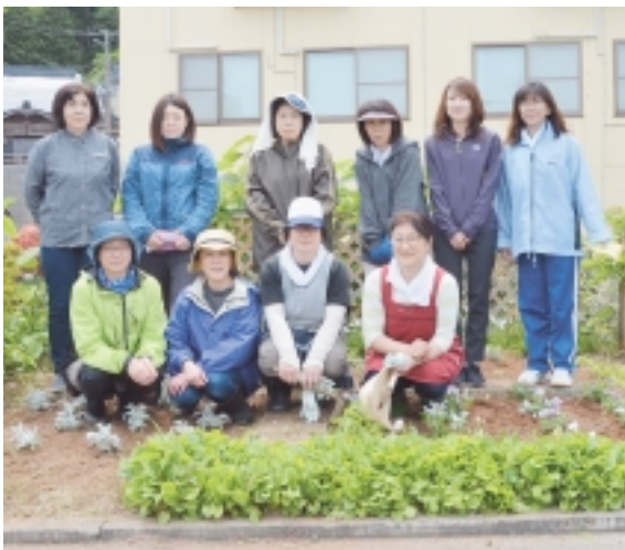
みなさまのお越しをお待ちしております