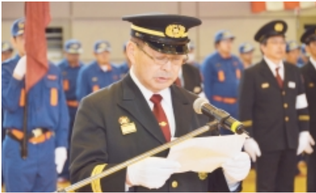
駒嶺消防団長による現況報告