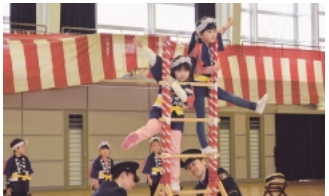
幼年消防クラブ演技