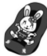
カチャピョン チャイルドシート着用推進 シンボルマーク

シートベルト等を正しく着用しないと、車外放出や前席への衝突などの危険があります。 運転者が自分と同乗者の「命を守る」という意識を持ち、すべての座席でシートベルト・チャイルドシートを着用しましょう。