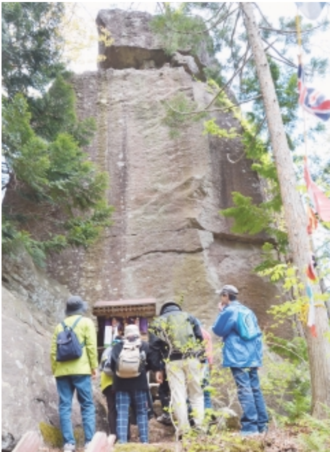
迫力満点の立石大明神