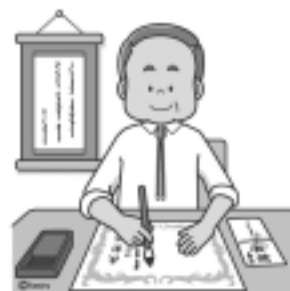
宛名・賞状書き 簡単な事務・整理 等