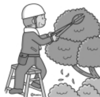
植栽の剪定 (高所を除く)