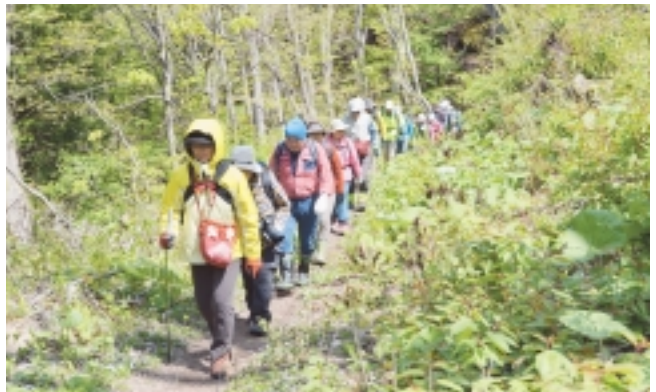
天気も良いし、山の中って気持ちいい〜♪