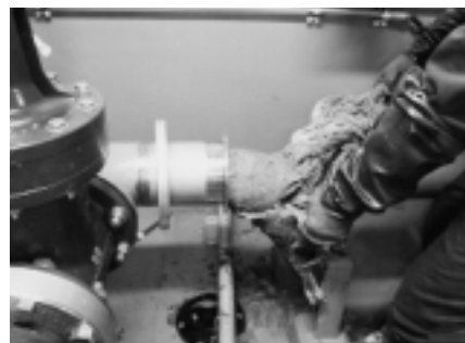
破砕機詰まりの状況