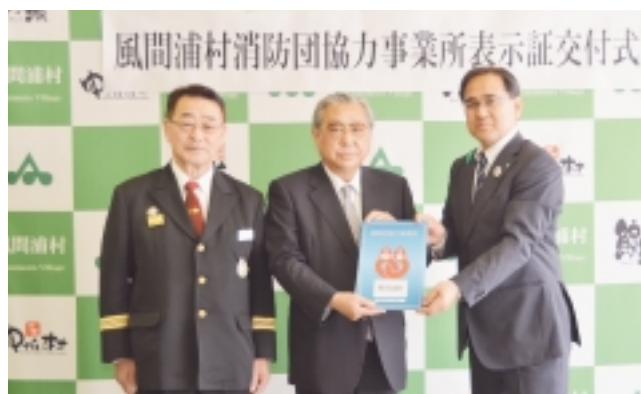
風間浦村消防団協力事業所表示証交付式