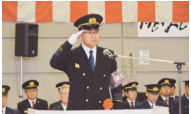
観閲者の富岡村長