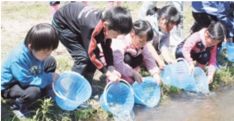
元気に大きくなってね～

当日は好天に恵まれ、放流場所となった風間浦村商工会裏側の河川敷には、易国間漁業協同組合関係者やむつ水産事務所職員が参集し、担当者からアユの稚魚を受け取った児童たちは「元気に大きくなってね」などと声をかけながら大事に放流していました。